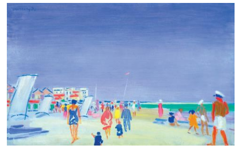
4. Vaszary János témája: vízpart