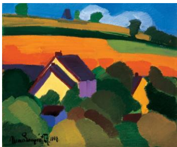
1. Nemes-Lampérth József: Tájkép