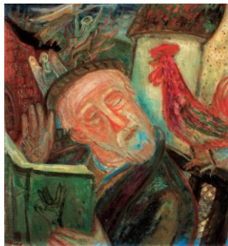
2. Ámos Imre: Szól a kakas