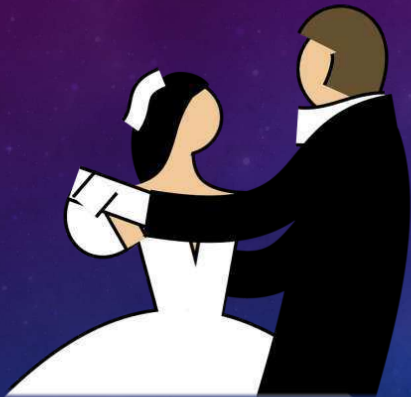
Egyetemista unokatestvér és vőlegénye