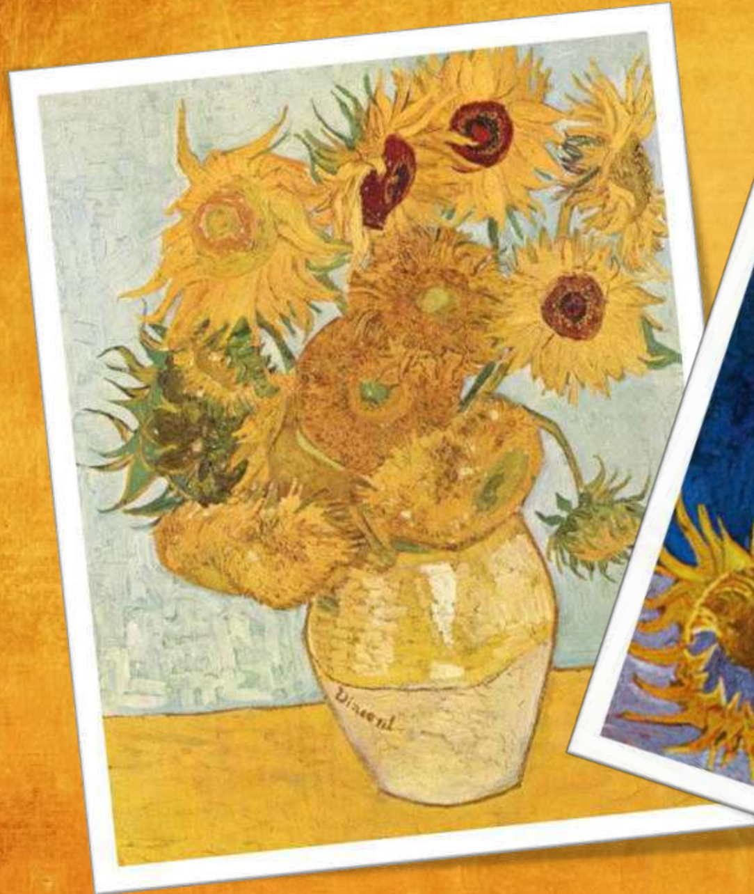
Váza tizenkét napraforgóval