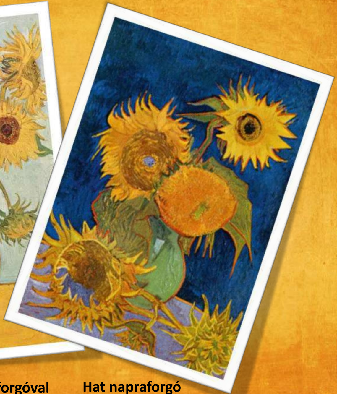
Hat napraforgó (megsemmisült 1945-ben)